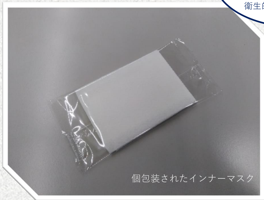
個包装されたインナーマスク

使い捨ての不織布マスクや布製マスクを繰り返し使用可能にするため、マスクの内側に置く不織布のこと。個別包装されているため、衛生的にご使用頂けます。